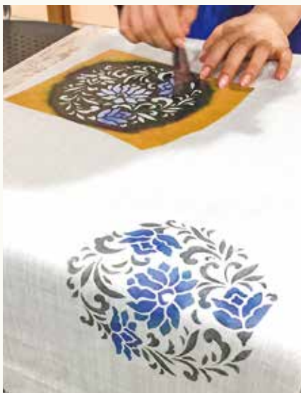
↑ 型紙を使用して文様を描く「型染め」を学びながら友禅染を制作します(写真はイメージ・桑原さん提供)