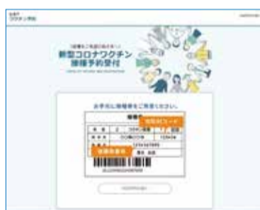
新システム トップページ