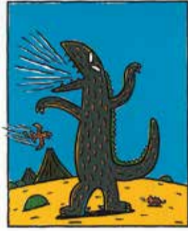
宮西達也『おまえ うまそうだな』 2003年 ポプラ社 ©宮西達也