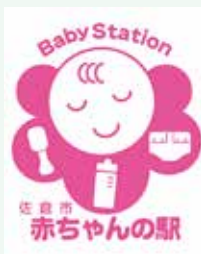
▲登録施設はこのステッカーが目印!

乳幼児を連れたママやパパが、安心して外出を楽しめる環境を整備するため、授乳やおむつ替えなどができる施設を「赤ちゃんの駅」として登録する取り組みを実施しています。 現在、市内では公共施設を中心に26か所の登録があります(5月1日現在)。今後は、スーパーや病院などの民間施設にもご協力いただき、赤ちゃんの駅をさらに広め、子育て世代の利便性アップに努めていきます。