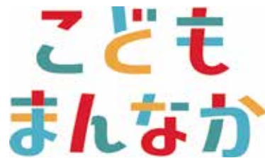
▲こども家庭庁 こどもまんなかマーク

こどもの権利が守られ、健やかに成長 することができ、だれもが将来にわたっ て幸せに生活できる社会のこどもです。 こどもたちが自分の能力を生かしたり、 希望を叶えたりすることができる社会を つくることで、未来の担い手を育てるこ ともにも繋がります。