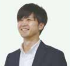
こども政策課 根本主事

一人ひとりの思いやりの気持ちが、「こどもまんなか社会」の実現に繋がっていきます。より良い子育て環境と、子どもたちが自分の気持ちを大事にし、伝えられる環境づくりのため、ご協力をお願いします。