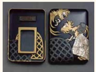
杉林古香(浅井忠図案)「鶏合時絵硯箱」(1906年、佐倉市立美術館蔵)

佐倉藩士の子として生まれ、近代日本洋画壇を代表する作家として知られている浅井忠(1856～1907)。その弟子で親戚でもある洋画家に都鳥英喜(1873～1943)や倉田白羊(1881～1938)がいます。