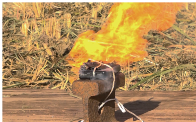
▲ 衝撃を加えたリチウムイオン電池から発火する様子（令和 7 年 11 月に市内で行った実証実験にて）

モバイルバッテリーやリチウムイオン電池などは、絶対に集積所に出さないでください。