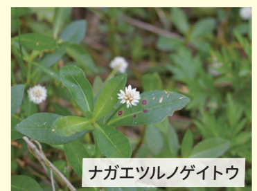
ナガエツルノゲイトウ