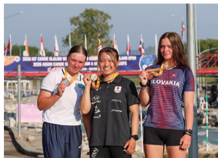
▲多くのメダルを獲得して、今後への弾みをつけました！