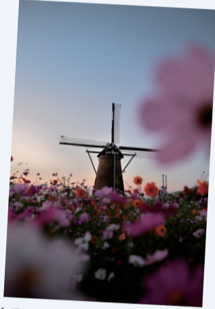
【作品名】秋桜と愛 【撮影場所】佐倉ふるさと広場