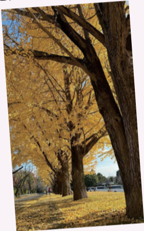
【作品名】イチョウ散歩道 【撮影場所】佐倉城址公園