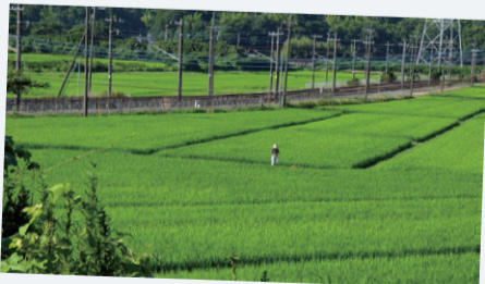
【作品名】盛夏の手入れ 【撮影場所】長熊