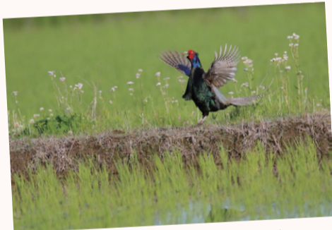
【作品名】縄張り主張の雄叫び 【撮影場所】先崎