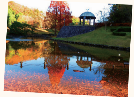
【作品名】燦燦 【撮影場所】七井戸公園