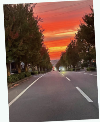
【作品名】未来に続く道 【撮影場所】山王小前の道路