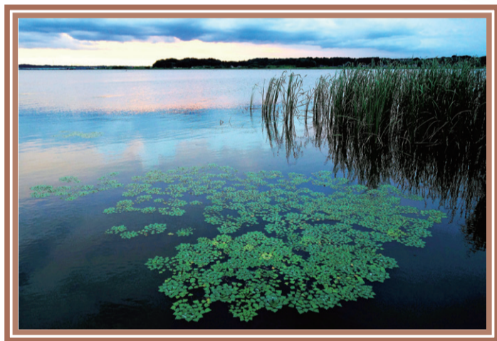
【作品名】 菱の舞・印旛沼遠望 【撮影場所】 サンセットヒルズ下棧橋

佐倉市景観審議会委員による、専門的な視点による投票です。一般投票と違う評価軸で公平に審査します。