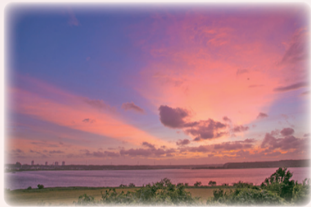
固 佐倉の魅力推進課 ☎ 484-6146