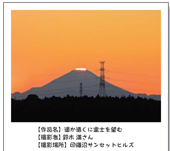
【作品名】 遙か遠くに富士を望む 【撮影者】 鈴木 満さん 【撮影場所】 印旛沼サンセットヒルズ

佐倉からは富士山は見えないと思っている人が多い。佐倉城址公園と併せてサンセットヒルズは富士山の夕日がきれいです。