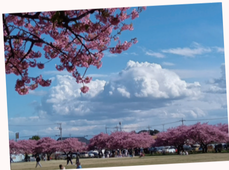
【作品名】ほっこり 【撮影場所】西志津スポーツ等多目的広場