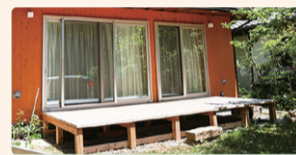
▲すぐに庭へ出てのびのび遊べるよう、デッキもつくりました!

おかげで理想の家に出会え、家族全員で充実した生活を送れています。また、近所に子育て支援センターが複数あるなど、予想以上に子育てしやすい環境なので、特にこれから佐倉市で住宅の購入を考えている子育て世代のかたは、空き家・空き地バンクもチェックしてみてもいいかもしれませんね。