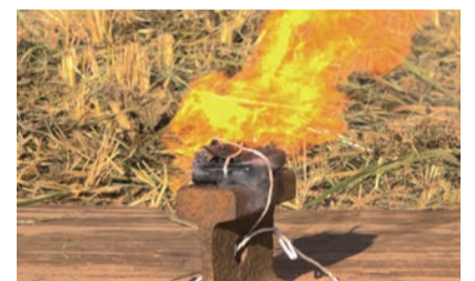
▲ 衝撃を加えたリチウムイオン電池から発火の様子(令和7年11月に市内で行った実証実験にて)

火災事故が発生すると、隣接する住宅や市民、収集作業員に重大な被害を及ぼす恐れがあり、ごみ収集車の故障や収集の遅れのほか、処理施設の停止などの原因になります。ごみの適切な分別に、ご理解ご協力をお願いします。