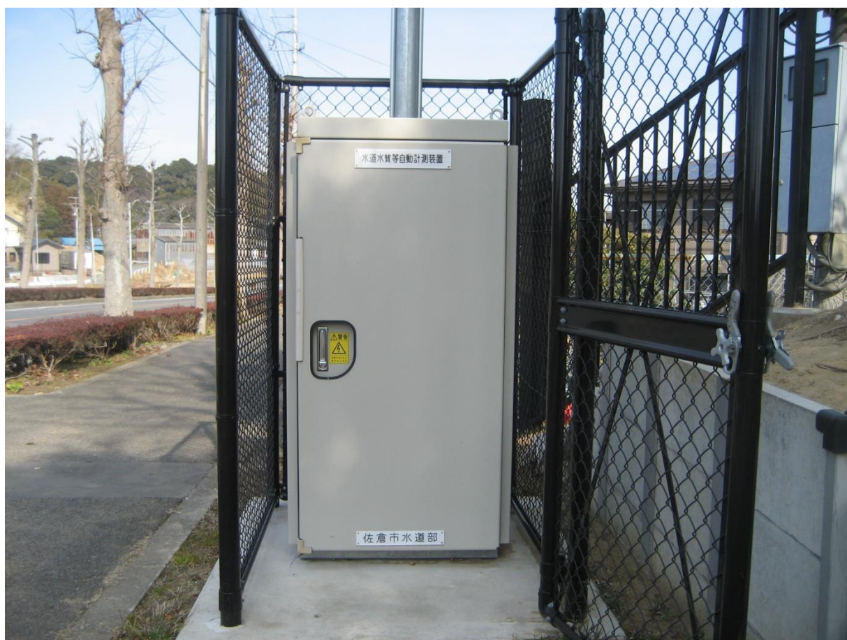
水道水質等自動計測装置

佐倉市上下水道部では、日頃から市民の皆様が安心して飲んでいただける水道水の供給を最優先に考え、水道法に基づいた適切な水質検査を実施してまいりました。