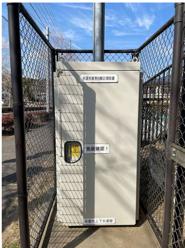
自動水質測定装置

佐倉市上下水道部では、日頃から市民の皆様が安心して飲んでいただける水道水の供給を最優先に考え、水道法に基づいた適切な水質検査を実施してまいりました。