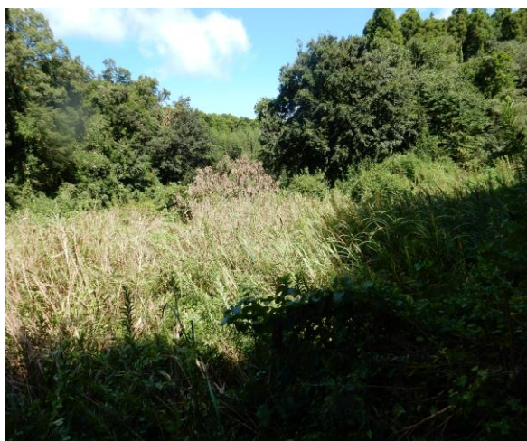
数十年耕作がされていない田

農業委員会委員及び農地利用最適化推進委員が、担当区域の、農地の調査を実施し、遊休農地等の現状を把握しました。（市内では、農地、約3千ヘクタールの内、約125ヘクタールの遊休農地が確認されています。）令和3年度調査