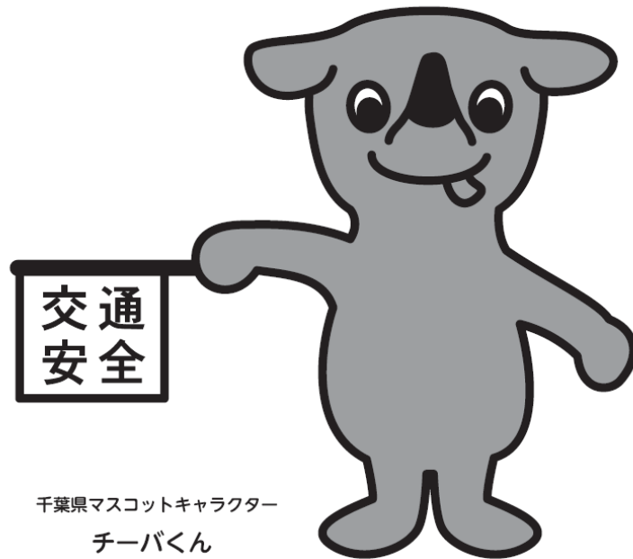
千葉県マスコットキャラクター チーバくん