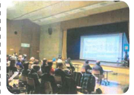
まちづくり実践報告会