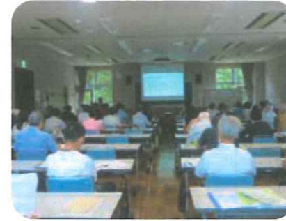
さまざまな一般教養の講義

1、2年生は佐倉市について学ぶほか、歴史、健康、環境、生きがい、福祉などの一般教養の学習を通して、新たな自分や多くの仲間、地域との出会いを広げます。2年生では、グループにわかれて自分たちで考えた「まちづくり活動」の実践を行います。