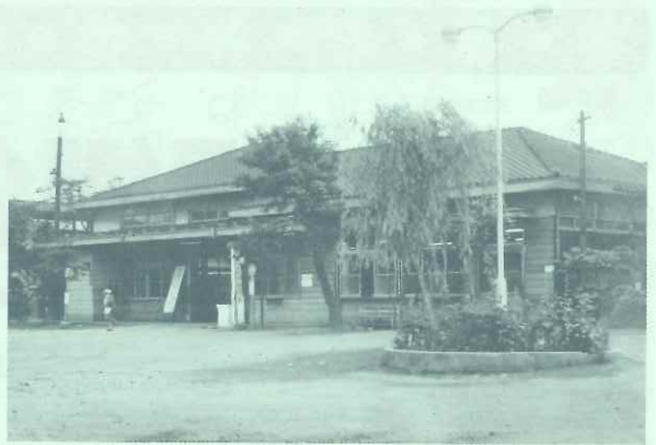
昭和41年6月19日