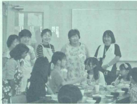
協力していただいた地域の方々、ありがとうございました

最後に早朝や夕方の忙しい時間帯に、快くご協力くださった地域の皆様に深く感謝申し上げます。