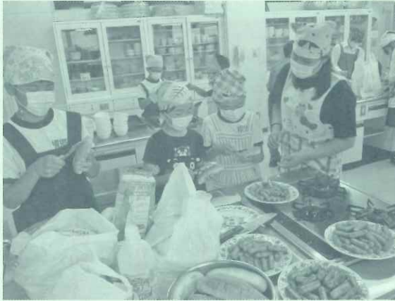
朝食のホットドッグを30人分作っています

通学合宿は、子どもたちにたくましく生き抜く力を身につけ、地域との関わりに目を向けることを目的に、公民館で2泊3日の共同生活体験をしながら、学校に通学する事業です。今年で15回目となる通学合宿は、根郷小学校4年生～6年生の児童17人(男子6人、女子11人)が参加し、6月18日(日)～20日(火)に、実施しました。