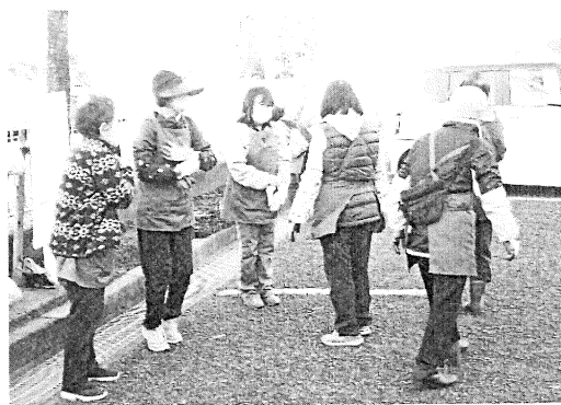
↑ 作業前の打合せの様子。お互いの情報交換も大切な時間です

令和2年度以来、新型コロナウイルスの流行により、活動ができない時期もあまりました。会員集めも大変厳しい状況が続きました。