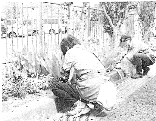
↑ 4月花壇の手入れ。昨年植えたチューリップが見ごろになっています

「花の応援団」は、花作りのボランテイア団体として、根郷公民館の花壇の草取り、苗木の植え付けなどの活動を行っています。花壇の手入れを通して、公民館をご利用いただく皆さんに、四季折々の花を眺めながら、気持ちよく利用して頂けるよう活動しています。