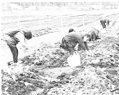
↑ ふるさと広場での球根掘の様子

4月28日、朝から会員のみならずにも参加していただき、球根の採取を行いました。秋には公民館の花壇に植えられます