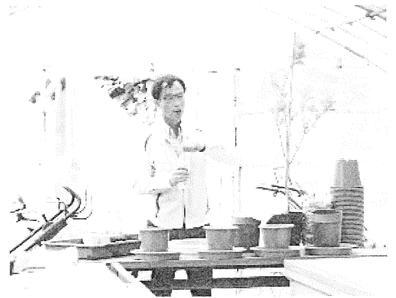
↑ハーブ園で実技を交えての講義

ローゼルとは一言で言えば『食用ハイベスカス』のこと。庭や花壇を彩ることはもちろん、食べても栄養価の高い植物です。公民館での講義に加え、ロー