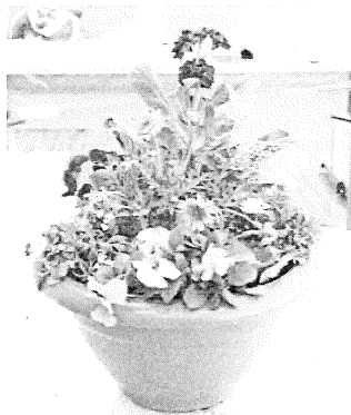
↑様々な草花を組み合わせ完成