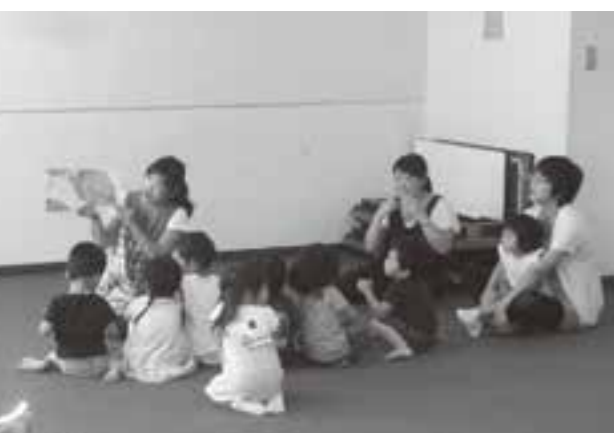
みんな絵本が大好き

親子で遊ぶ ぽっぽちゃん くじぶ(前期) 親子で参加する講座です。子どもとのふれあいをとおして、地域に友達をつくりませんか。 日時 5月11日～7月13日の毎週木曜日と5月20日(土)、7月1日(土) 全12回 午前10時～11時30分