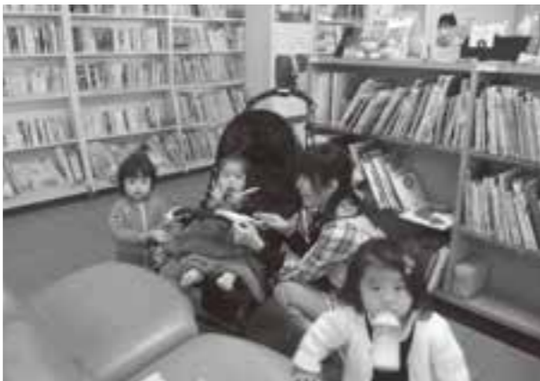
預かり保育していただける方、募集中です!

公民館で行う親子向けの主催事業で、小さいお子さんの預かり保育をしていただける方を募集しています。子育て経験のある方大歓迎です。 ◇ 問い合わせ 電話で