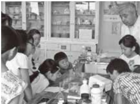
真剣に計測中 楽しい実験がいっぱい!

日時 6月～12月の原則第1土曜日(全7回)午後1時～午後3時(集合は、午後0時50分) 場所 根郷公民館 対象 小学校4～6年生 定員 16人 参加費 三千円(教材費)