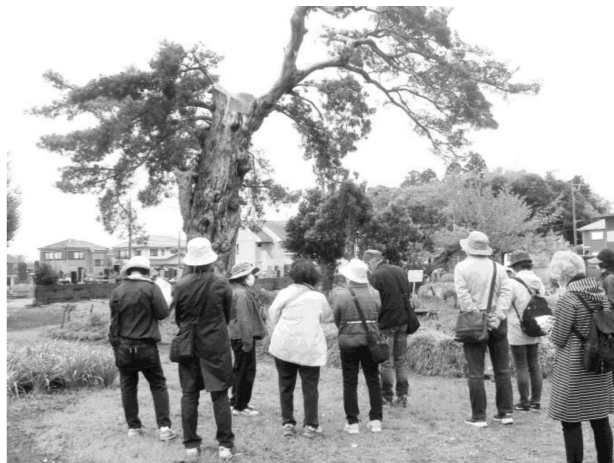
↓春の野草観察会から