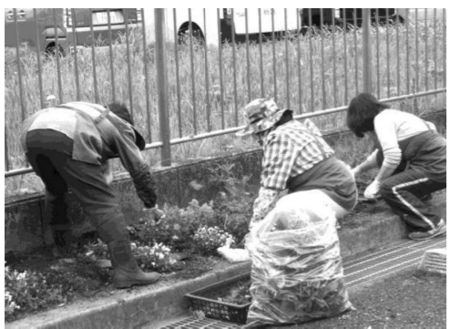
駐車場脇の花壇の手入れを行うボランティア