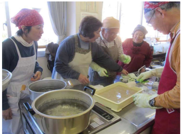
↓こんにやく作りの様子