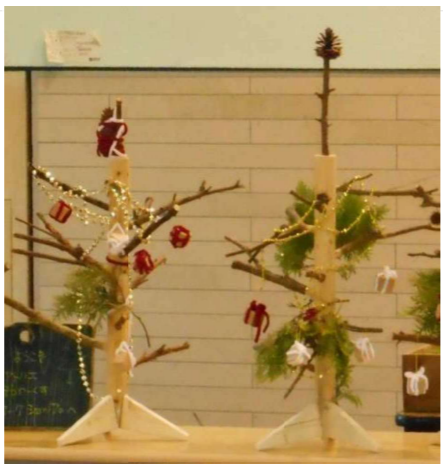
↓昨年作製した木エクラスマスツリー

木エクラフトとは、木の枝や木の葉、木の実などを使った木の工作です。この時期クリスマスにちなんだ作品を、家族で手作りしてみませんか？