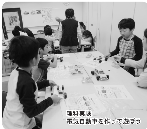
理科実験 電気自動車を作って遊ぼう

『志津子ども教室』は、小学生を対象に佐倉の地域素材をおりませた体験学習の講座です。地域の人たちから学び、「つくる楽しさ」「わかる喜び」「できる自信」を育むことを目指します。 ＊小学生あつまれ! 佐倉っ子塾(前期) 志津子ども教室