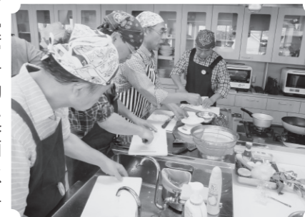
おやじの食事学 実習風景

『しづ市民大学』は、人々の出会いの場・地域づくりの場の核となり、地域住民への学習機会を提供し、一人ひとりの生きがいの発見・地域の仲間作りを通して「住み良いまちづくり」を目指し、開設します。 学習内容は、講座に参加する・講話を聴くだけの座学ではなく、多彩な学習を学習者自らが創造し、企画と運営活動に参画し、市民活動の推進を図ります。