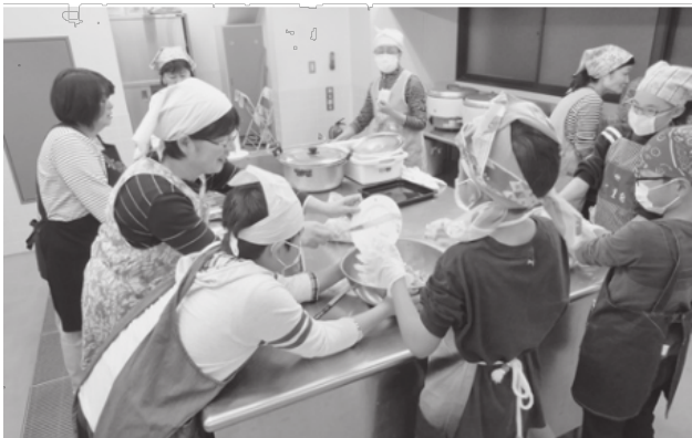
ハンバーグ、おいしく作れるかな？

皆様にご協力いただき、下志津小学校通学合宿を無事に終わることができました。朝は早くから、夜は遅くまでボランティアとしてご協力いただき、ありがとうございました。今後ともよろしく願いいたします。