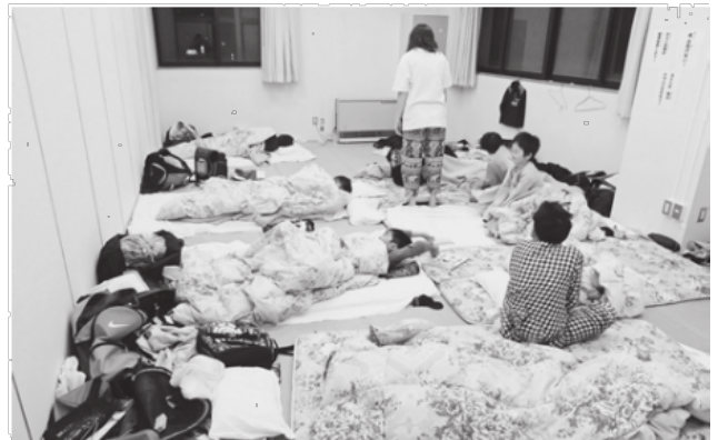
朝5時10分…。ちょっと眠い…？