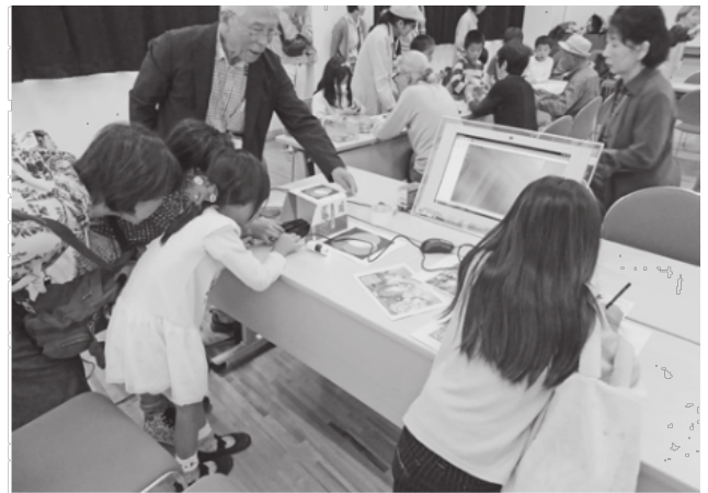
ふしぎな科学の世界を体験!!