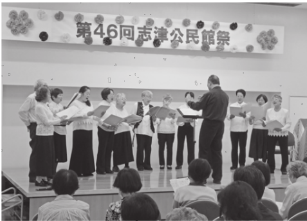
美しい歌声が響きました

3日間の合計来場者数は2,919人、参加者の皆様からの発案により案内所に設置されました台風被害義援金募金箱には27,137円が集まり、公民館祭終了後に佐倉市社会福祉協議会を通じ全額を寄付いたしました。ご協力ありがとうございました。