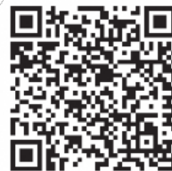
スマートフォン用 予約QRコード