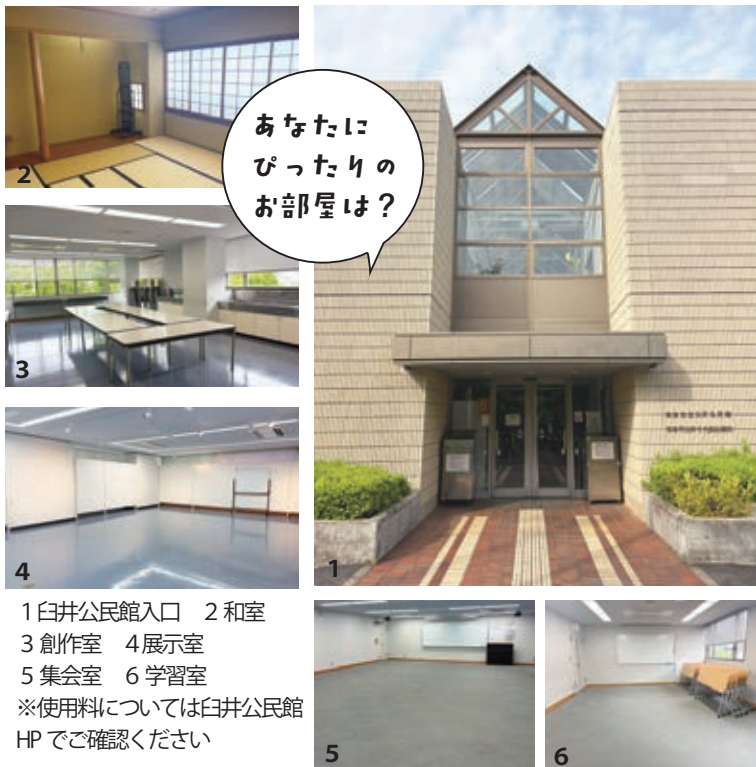
1 白井公民館入口 2 和室 3 創作室 4 展示室 5 集会室 6 学習室 ※使用料については白井公民館HPでご確認ください