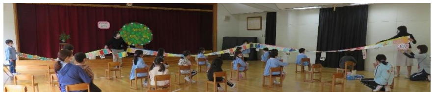
おたより帳を109冊分つなげた長さをみんなで見て、109年間の長さを感じました。とっても長かったね。

10月29日、お陰様で本園は創立109周年を迎えることができました。大正2年に創立し、地域の皆様に支えられながら歴史を刻んで、大勢のお子さん達がとちの木の下で元気に遊び、巣立っていかれました。卒園生の数は、1万1千人を超えています。幼稚園では前日に、創立記念式をしてみんなでお祝いをしました。