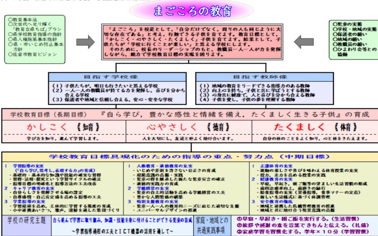
令和5年度 佐倉市立佐倉小学校 学校経営全体計画図

以下に学校経営の概略について示しました。これからは、よりよい学校教育を通してよりよい社会を創るという理念を学校と社会とが共有して、連携・協働によりその実現を図っていくことが求められています。1年間、どうぞよろしくお願いいたします。