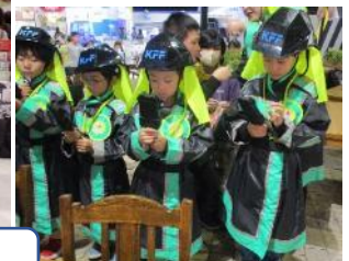
1、2年生校外学習 カンドゥ