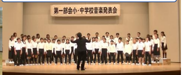
第一部会小・中学校音楽発表会