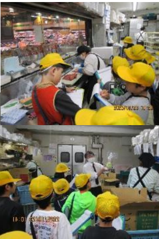
3年生 スーパー見学