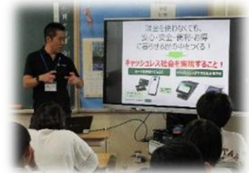
6年 ゲストティーチャーによるキャリア教育