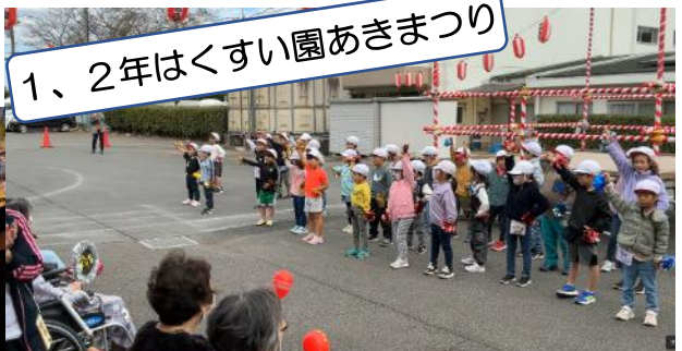
1、2年はくすい園あきまつり