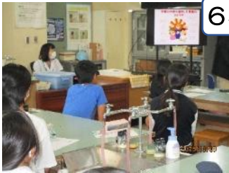
6年薬物乱用防止教室