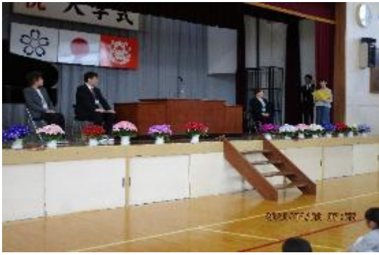
4月6日 着任式 教頭先生をはじめ3名の新しい先生方をお迎えしました。