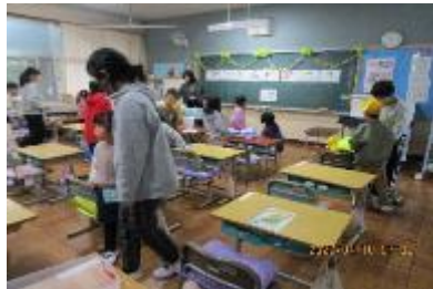
4月10日～頼もしい6年生 1年生はまだ、学習の準備や朝の会、給食の時間などに時間がかかるため、6年生が1年生の教室に行き助けてくれます。頼もしい6年生です。