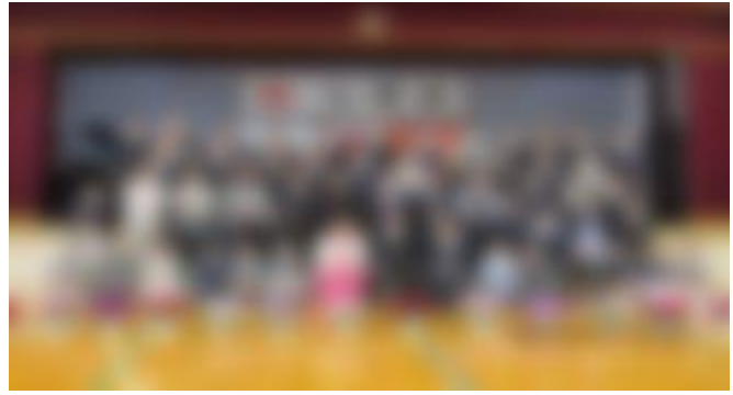
4月9日 入学式 19名の1年生が元気に入りました。 内郷小143名の仲間入りです。