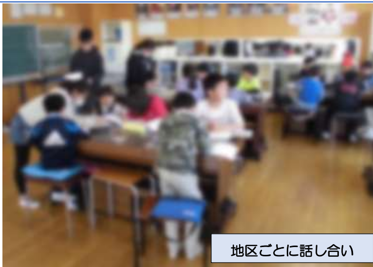
地区ごとに話し合い