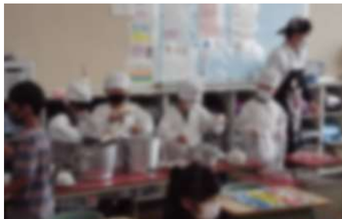
給食当番 上手ですね！服装もきちんとしています