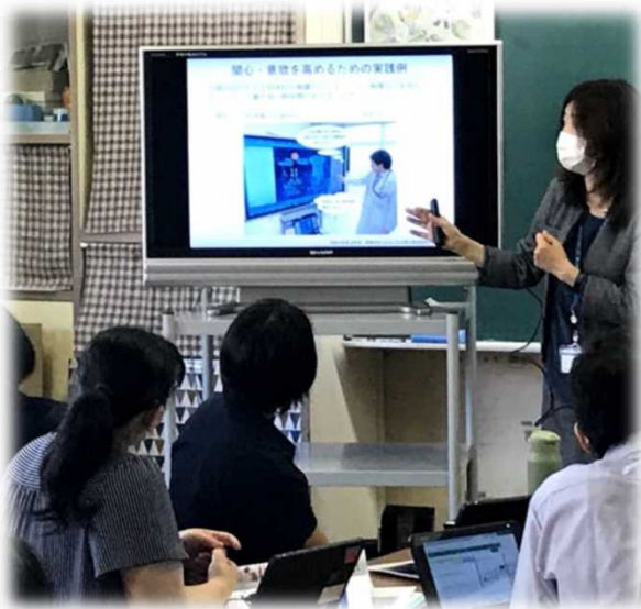
講師を招いての研修