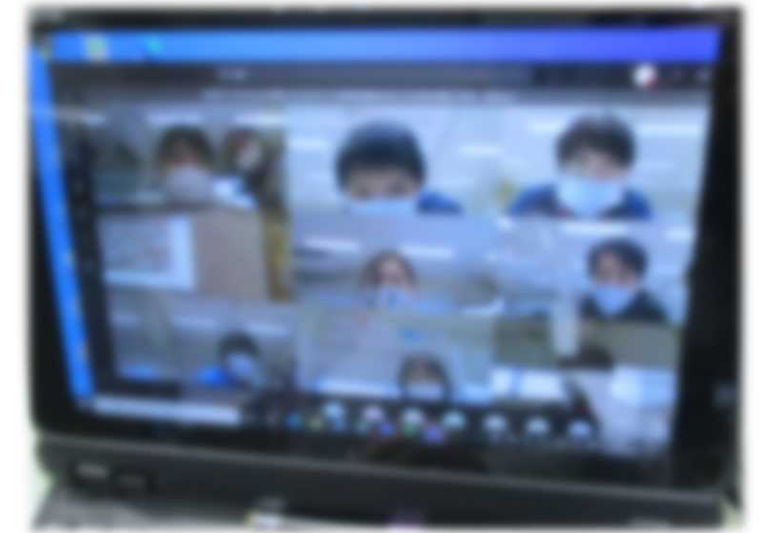
教職員同士のオンライン研修