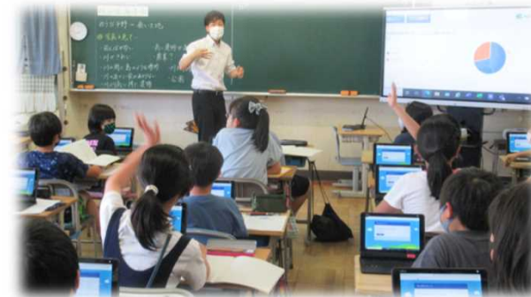
ノートとタブレットの併用