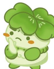
千葉県子どもと親のサポートセンター マスコットキャラクター こさぼん