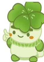
千葉県子どもと親のサポートセンター

<千葉県子どもと親のサポートセンター住所> 〒263-0043 千葉市稲毛区小仲台5-10-2 千葉県子どもと親のサポートセンター 支援事業部 電話 043-207-6028