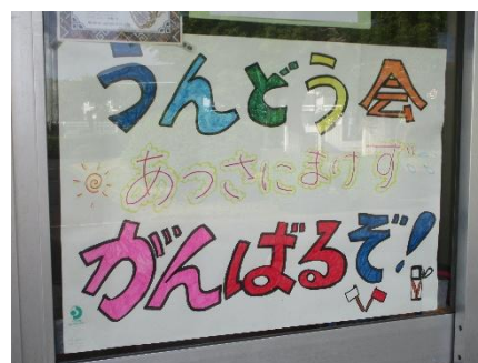
【学童の入り口に貼られたポスター】 励ましありがとうございます！

グラムは定番化してきました。その一方、子供たちの活躍の場を広げる工夫として、昨年度は団体種目を取り入れ、今年度はさらに小学校最後の運動会となる6年生のプログラムに徒競走を追加しました。コーナーからぐんぐん加速し、直線を力強く駆け抜ける6年生の姿は下級生の憧れとして記憶に刻まれたことと思います。また、運動会を通して子供たちが身に付けた、協調性やルールの理解、勝敗だけではない自他の肯定などの社会性は、さらに子供たちを豊かに成長させるはずです。皆様の温かい応援、終了後の片づけへのご協力に改めて感謝申し上げます。