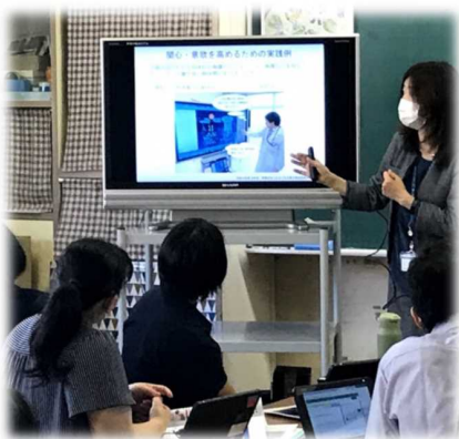
講師を招いての研修