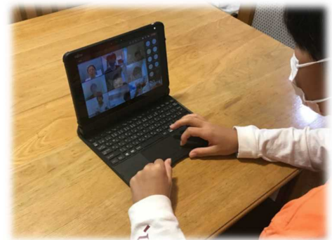
オンラインによる 学活・健康観察