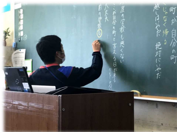
オンラインによる授業配信