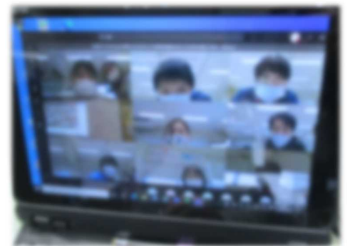
教職員同士のオンライン研修