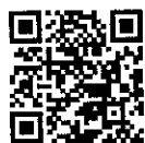
ジモティー トップページ