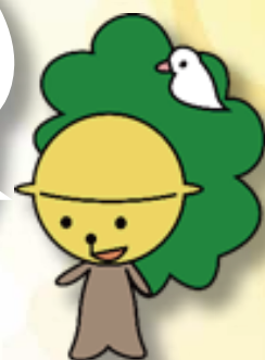
弥富小・幼キャラクター 「やっとみー」

自然が多く 地域の方々もとても親切で 学区外からの登校でも すぐに受け入れます。