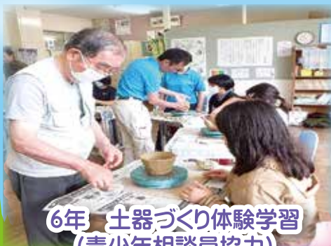
6年 土器づくり体験学習 (青少年相談員協力)