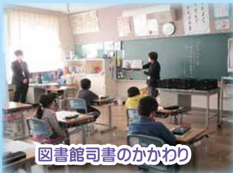
図書館司書のかかわり