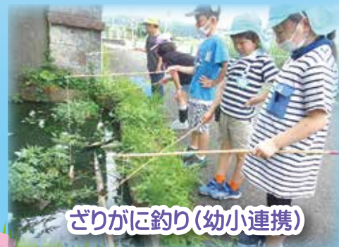
ざりがに釣り(幼小連携)