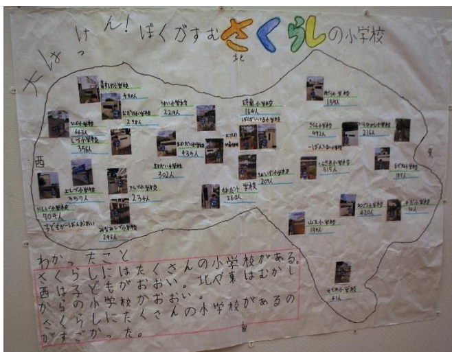
佐倉市内の小学校マップ