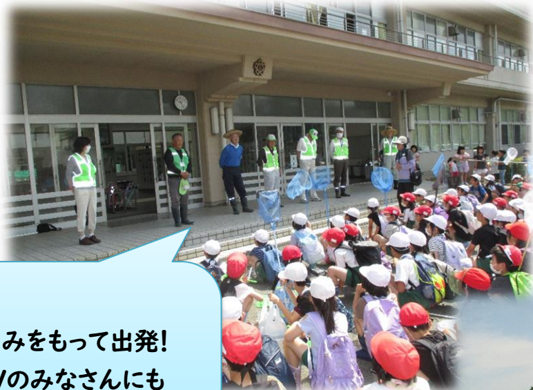
あみをもって出発! SGVのみなさんにも 元気に挨拶できました。