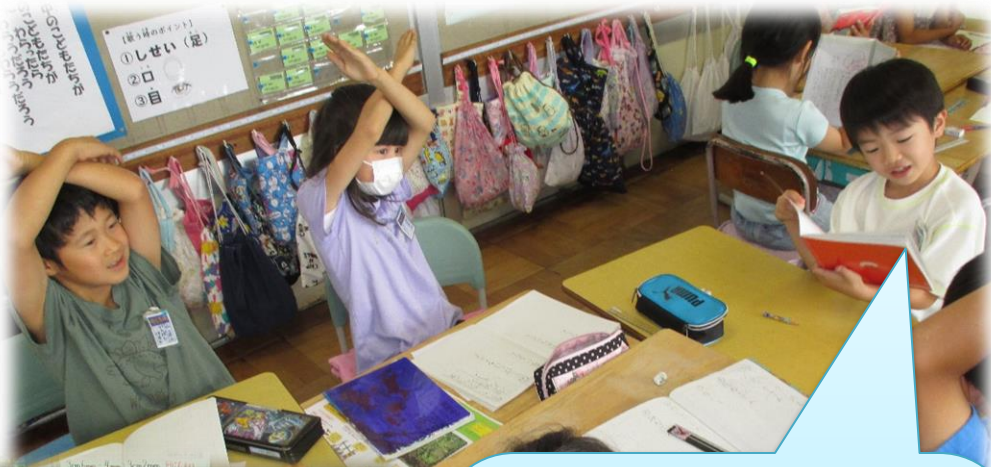
「○でしょうか。×でしょうか。」 本から得た情報をもとに 考えた生き物クイズ・・・ 意外な難問も飛び出しました!