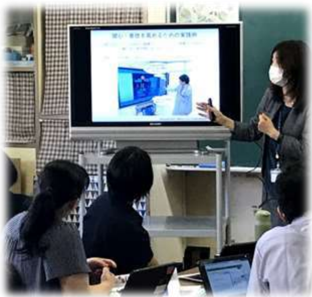
講師を招いての研修