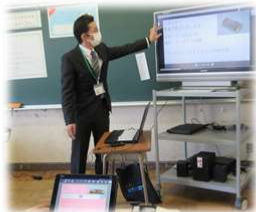
発表・教え合い学習