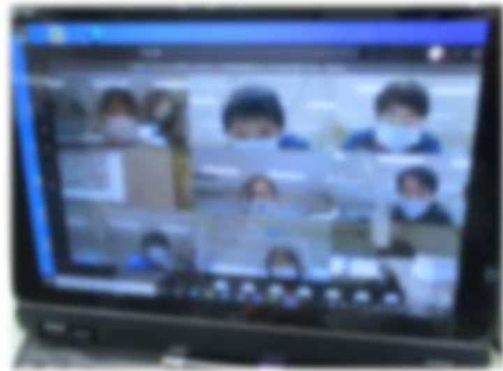
教職員同士のオンライン研修