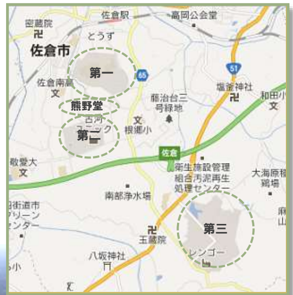
佐倉第一・第二・熊野堂工業団地