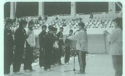
中学生の力強い活躍が印象的だった綱引き大会