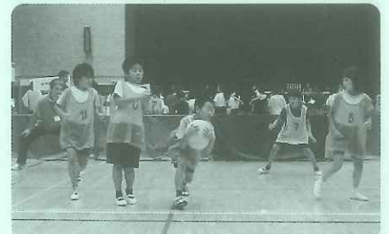
ソフトドッジ大会では元気なプレーに大歓声

わたしたち青少年相談員は、佐倉で育っていく皆さんが、わたしたちの活動を少しでも身近に感じてもらえるよう、これからも青少年の笑顔のために活動に取り組んでいきます。