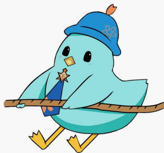
綱引きバージョン