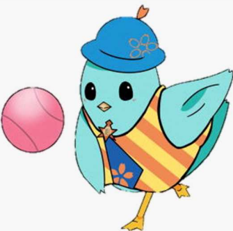
ドッジボールバージョン

相談員主催の3大行事「ソフトドッジボール交流大会」「綱引き大会」「たこあげ大会」に参加しているちゅんさく君が仲間入り！