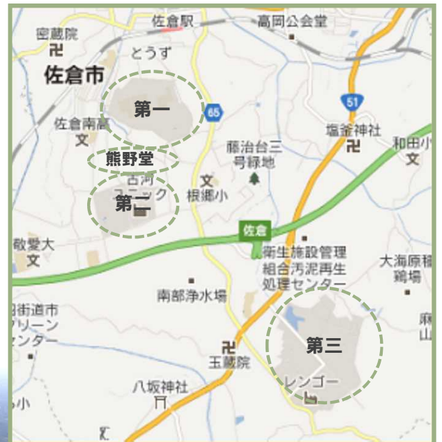
佐倉第一・第二・熊野堂工業団地