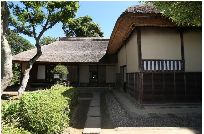
旧但馬家住宅 ( ① )