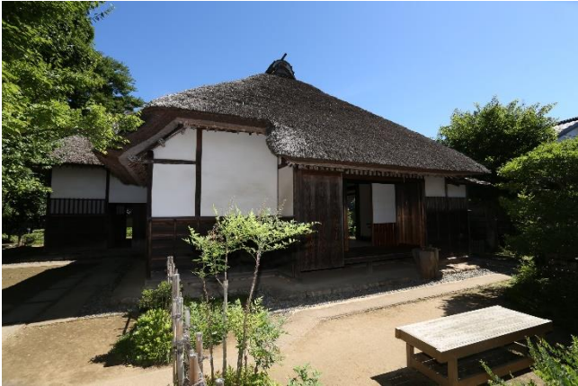
旧河原家住宅 ( ② )