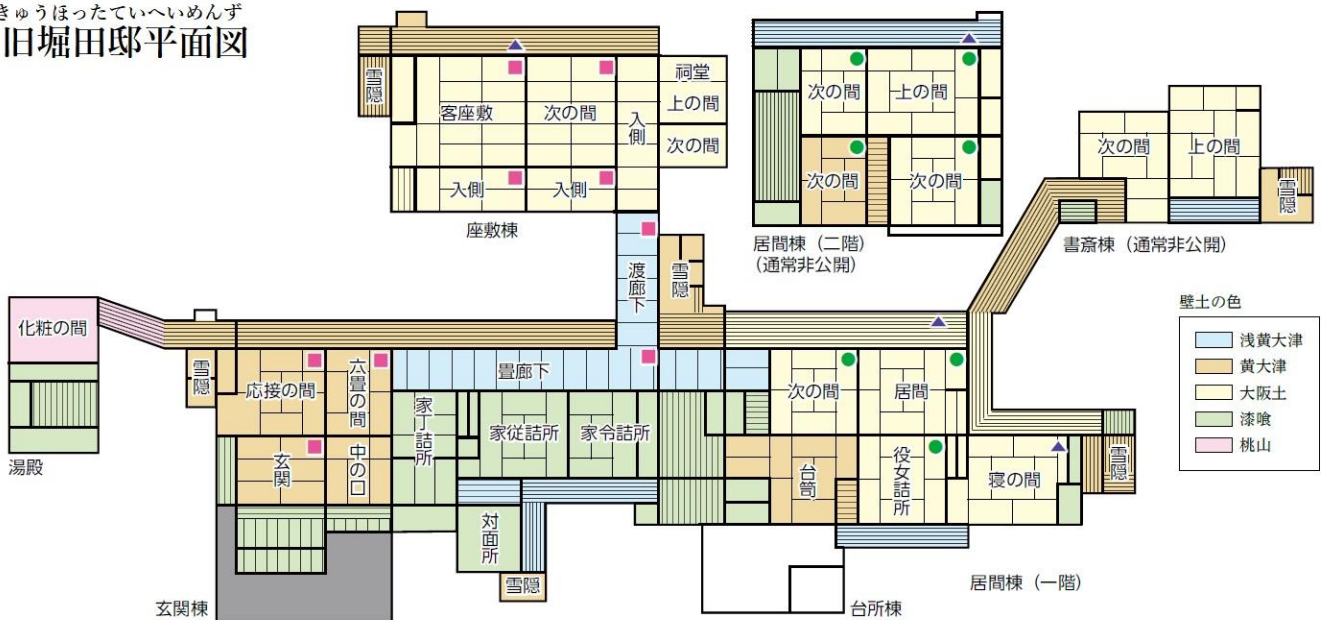
きゅうほったていへいめんず 旧堀田邸平面図

どこが き 気になったのか、 きょうみ 興味をもったのかその理由も書いてみましょう。