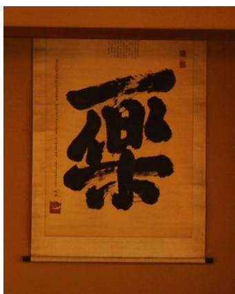
らく かけじく ③「楽」の掛軸