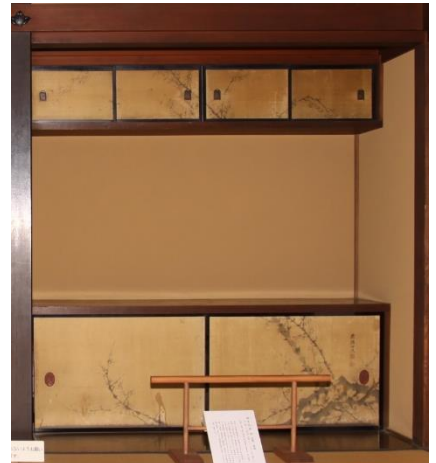
うめ え か とだな ②梅の絵が描かれた戸棚